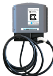
CS-100, 19.2 kW CA