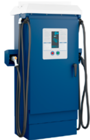
Smart CC, 50 kW Compatible avec les véhicules LionC et Lion6 seulement.