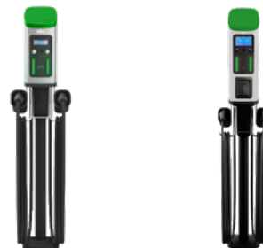
Blink Dual serie 7, serie 8 (nouveau modèle, remplacement du modèle IQ200, décision du manufacturier)