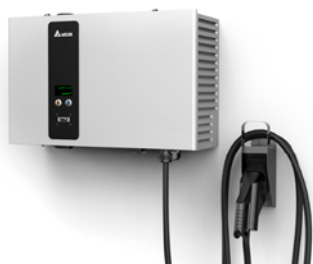
Wallbox, 25 kW (500 volt) CC Compatible avec les véhicules LionC et Lion6 seulement.