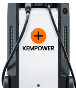
Chargeur mobile 50 kW