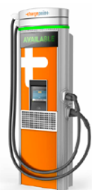
Express 250, 62,5 kW CC