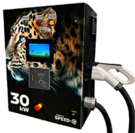
Speed-E, 30 kW, 40kW