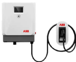
Terra CC WB, 24 kW 1 ph (208 V/240 V tension d'entrée) Terra CC WB, 24 kW 3ph (480 V tension d'entrée)