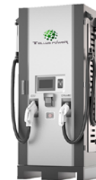
60 kW CC