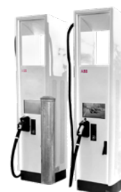
Terra HP, 175/350 kW