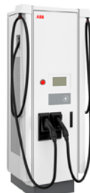
Terra 94, 90 kW CC Terra 124, 120 kW CC Terra 184, 180 kW CC