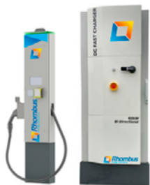
Rhombus 60 kW, CC - V2G