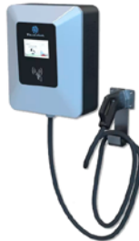
30 kW CC