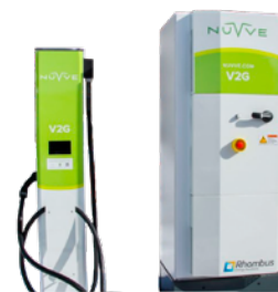
Borne de recharge CC pour véhicules lourds, 60 kW

Notes : • Les bornes de recharge CA sont compatibles avec les véhicules Lion ayant un chargeur embarqué. • Certaines bornes présentes dans cette liste ou disponibles sur le marché ne seront pas compatibles avec la nouvelle génération de véhicules Lion avec Batteries Lion. SVP consultez votre représentant pour plus d'information.