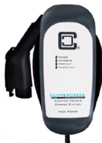
HCS-50, 9,6 kW CA