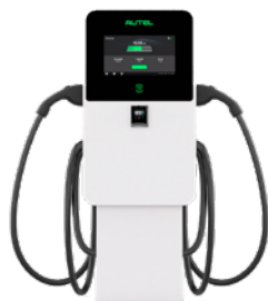
MaxiCharger CC Compact Autel, 40 kW CC - Double CCS-1