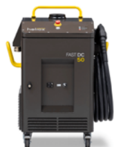
Chargeur mobile 50 kW